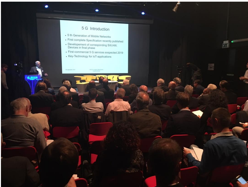
Guntram Kraus leitet die Session 1 und gibt eine Einführung in den Mobilfunk der fünften Generation 5G